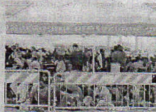
Migranti in città

ro che i zzisti. Ma titudini si a. Qualche attrice Savi a ha pubbli a, le foto dei affogati men di raggiunge ngiano anche io degli esseri come gli immigrati", è stam mento di un internauta. degli "io non sono razzista sono tutti. Anche movimenti qualche modo, legati al centro- destra. Cambia Vento, una delle liste della